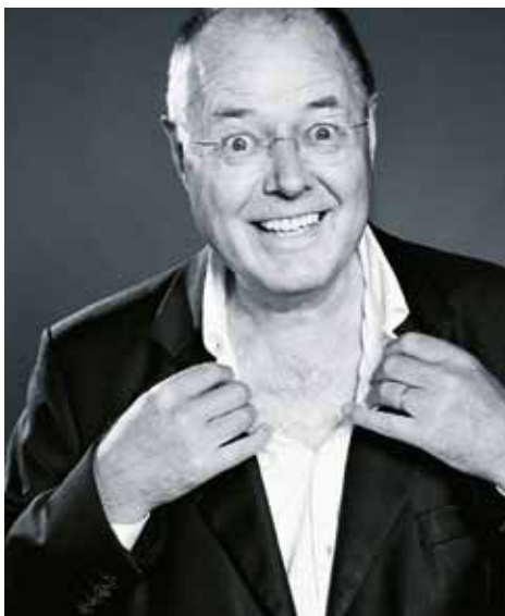
Eine Stilfrage: Tragen Sie unterm Hemd noch ein Unterhemd?