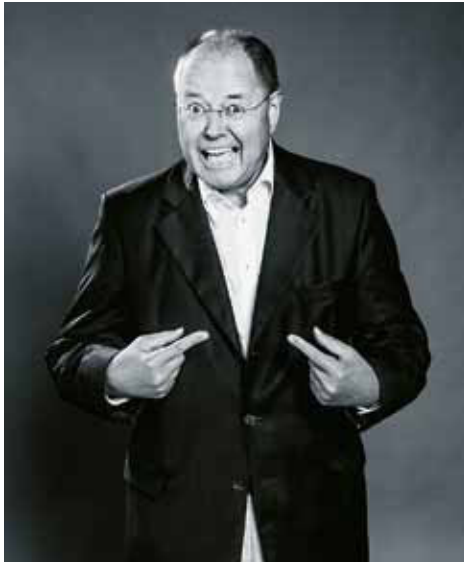
Nur 26 Prozent würden zurzeit die SPD wählen. Liegt das an Ihnen?

Kleine, der ehemalige Bild -Journalist, begleitet ihn. Das Interview dauert gerade einmal 25 Minuten. Steinbrück überlegt bei jeder Frage nur kurz, greift manchmal auf herumliegende Requisiten aus dem Fotostudio zurück und antwortet meist spontan. Für Presseemann Kleine bei einer Antwort »vielleicht etwas zu spontan«. Dieses Foto mit dem Stinkefinger, das würde er gern streichen, sagt Kleine beim Betrachten der Fotos nach dem Interview. Aber Steinbrück – bekannt für seine gradlinige Art, für seine Ecken und Kanten – lässt sich nicht dreinreden: »Nein, das ist okay so.«