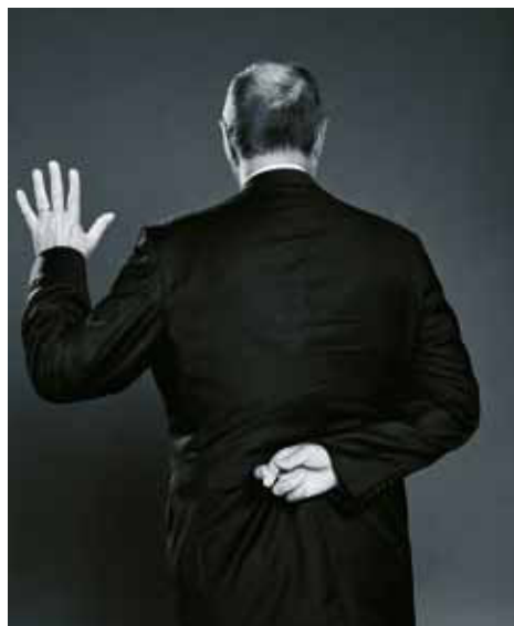
Auf einer Skala von eins bis zehn: Wie gut ist Angela Merkel als Krisenmanagerin? (1 = grottenschlecht, 10 = meisterhaft)