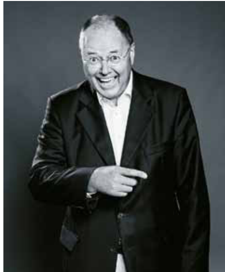
Der FDP-Chef Philipp Rösler spricht Ihnen die Befähigung zum Bundeskanzler ab. Haben Sie eine Botschaft an ihn?